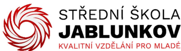
Obr. 4 Logo školy

Obrázky a tabulky menší než půl stránky mohou být zařazeny do textu. Pokud jsou větší, budou zařazeny do příloh. Obrázky se označují titulkem Obr. č. x a popisem obrázku pod obrázkem (viz Obr. 4).